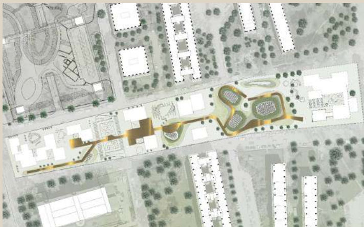
Villaggio Olimpico, Roma. Area 16-TTLine